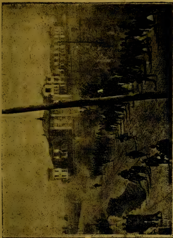
حرکت و حرکت اردوی طرفین نسیم آذان استانبول عسکرینک تحت الحفظ سوقلری.

بلوکاری کوندرمش-لردی . قطعته کزیده بولنان قسم کایسی ( اسپارطه قله ) ده بولنان مرکز اجتماعدن اعتباراً خط مستقیم استقامتده ایلریله مشدی . صول جناحی وادی به طوغری امتداد ایدیوردی .